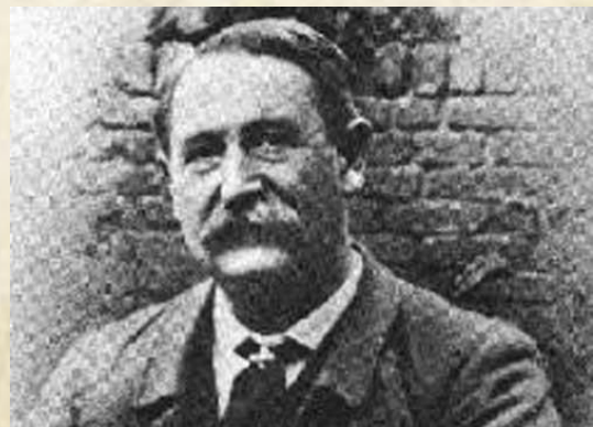
Inspecteur en chef - Abberline